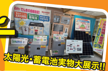
太陽光・蓄電池実物大展示!!